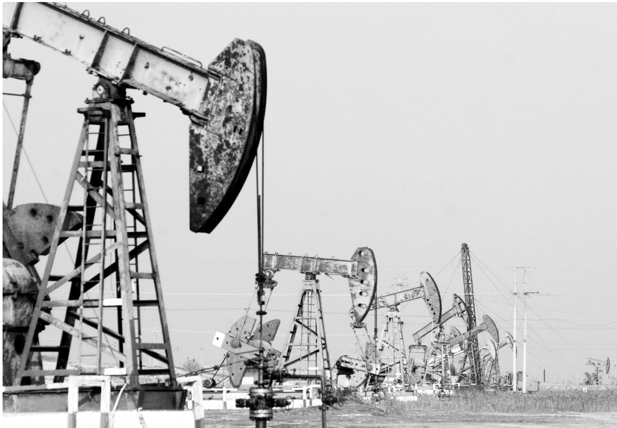
Siguen subsidiando a los pulpos petroleros

Gobierno tras gobierno, la historia se repite. Siempre ganan las petroleras. Ahora que el precio mundial del petróleo está por el piso, en vez de bajar los combustibles y así reducir los costos de fletes para dar un alivio al bolsillo del pueblo trabajador, el debate en el gobierno es con cuanto subsidiar a las petroleras "para que no pierdan". Como dijo Darío Martínez, diputado del Frente de Todos por Neuquén: "hay que buscar urgente un precio (por encima del costo mundial) para el 'barril criollo'". O sea la preocupación no es bajar los