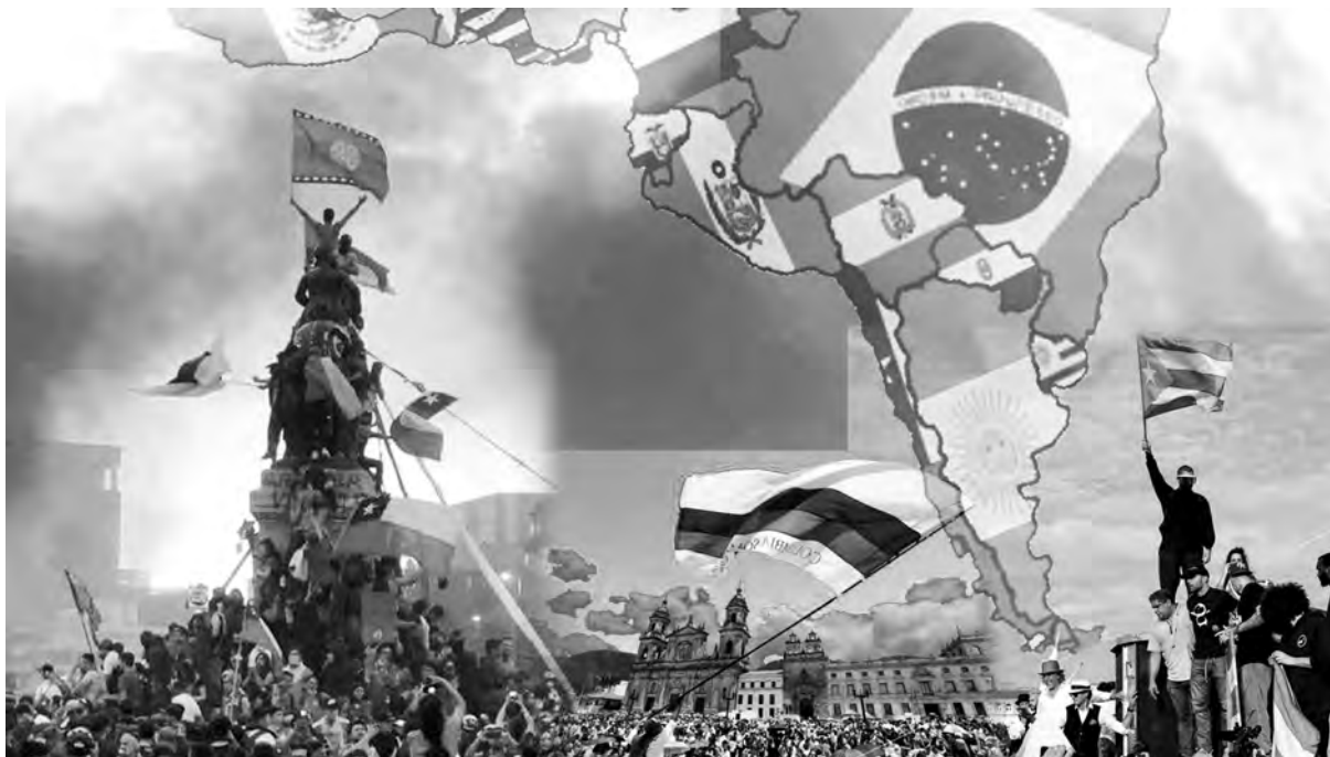
En Latinoamérica crecen las rebeliones contra los planes de ajuste

La apertura de la conferencia será el propio acto del 1º de Mayo en Plaza de Mayo para conmemorar el día Internacional de los Trabajadores, que esta vez será con un mayor perfil de lucha internacionalista ya que estarán presentes muchos de los dirigentes de las organizaciones hermanas de otros países que van a participar de