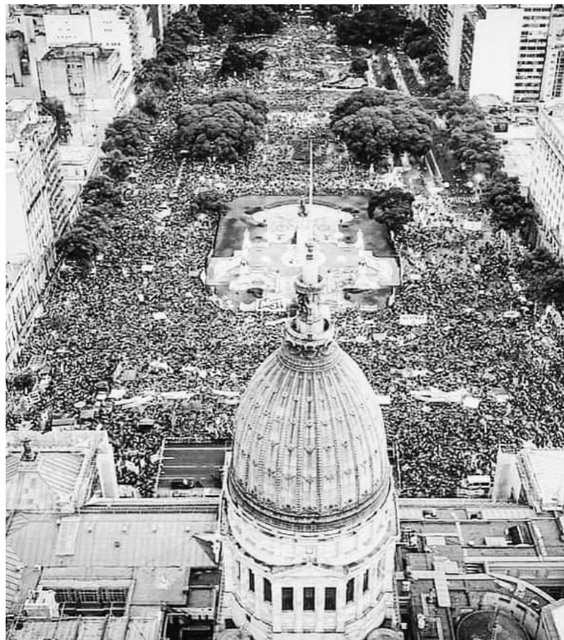
La enorme movilización del 9M en Buenos Aires

En Argentina, al momento de la movilización se habían contado más femicidios que días. Por eso, en el país del #NiUnaMenos, el reclamo por presupuesto para combatir la violencia de género continúa más vigente que nunca. La marcha en