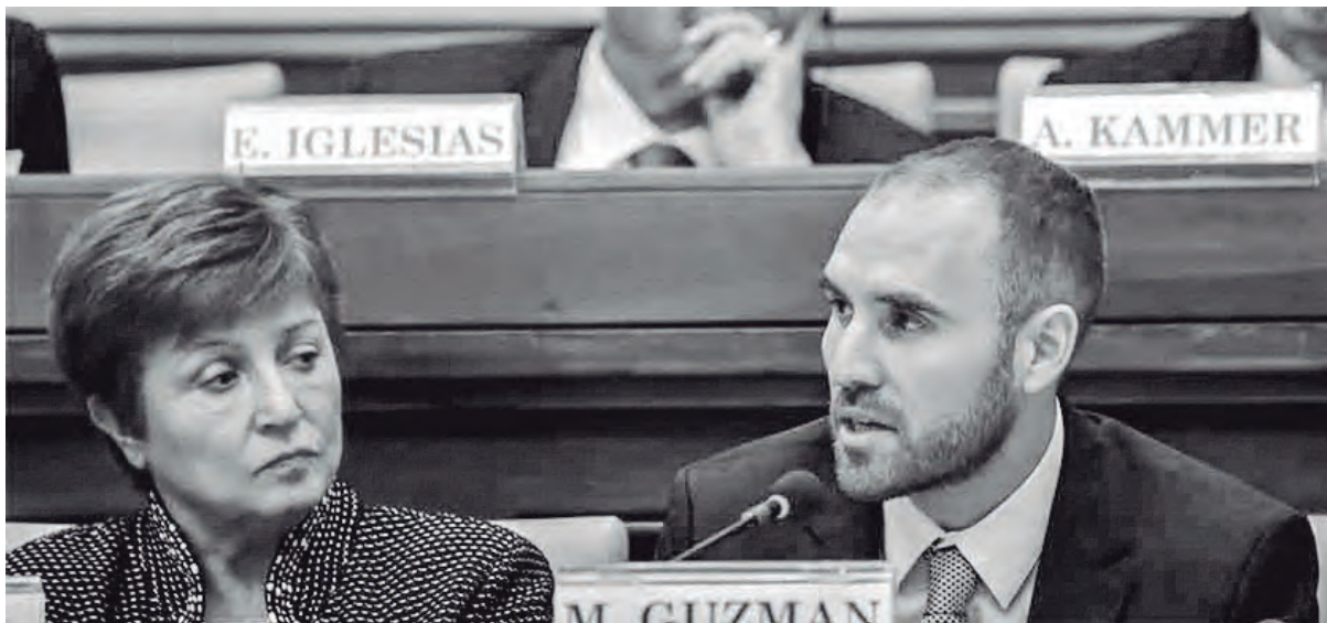
El gobierno insiste en continuar el acuerdo con el FMI y la negociación con los acreedores

Mientras el mundo entra en crisis total y en nuestro país estalla la crisis sanitaria, el gobierno de Alberto Fernández sigue con su cronograma de renegociación de deuda y pagando los vencimientos que caen semana a semana. ¡Hay que parar esa locura ya mismo! ¡Toda la plata debe ir para la emergencia! Hoy, más que nunca, hay que suspender inmediatamente todos los pagos de la deuda y romper con el FMI