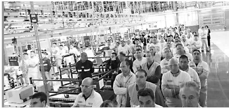
Pomigliano, Italia. Los trabajadores de Fiat han comenzado a realizar huelgas de forma espontánea, exigiendo medidas para protegerse del coronavirus

La respuesta obrera y la solidaridad de jóvenes y vecinos no se hacen esperar. Huelgas de trabajadores, solidaridad popular en los barrios y cacerolazos, son algunas de las manifestaciones del pueblo italiano contra su gobierno. El diario Il Manifesto informa en su edición del viernes 13: “El mundo obrero ha vuelto a hablar con rabia contra la decisión del gobierno de no detener la producción en las fábricas que se ha materializado cuando se abrieron las puertas: huelgas espontáneas, asambleas, el cese temporal de la producción”. Hubo huelgas en Mi-