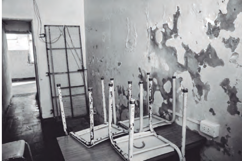
Las escuelas siguen con graves problemas de infraestructura

Que fue una medida improvisada y arrancada al gobierno lo confirma que lo hicieron casi a medianoche del domingo... y que querían que los docentes asistiéramos igual a cumplir horario, sin alumnos. La presión de los gobernadores, autoridades y funcionarios para que asistiéramos a las escuelas fue vergonzosa. Si no