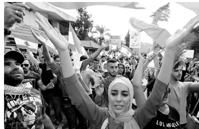
Líbano. La movilización popular obligó al gobierno a suspender el pago de la deuda

Argentina es un país mucho más grande, fuerte y autosuficiente para enfrentar a los usureros internacionales. La relación de fuerzas, si hubiera una clara disposición política para imponerla, se podría conquistar ganando a los trabajadores y al pueblo explicando que esa deuda es ilegítima e impagable, que esa plata fue para la bicicleta financiera y que si no rompemos con el FMI estamos condenados a más pobreza y saqueo. Explicando que en Latinoamérica el pueblo de Ecuador ya se rebeló contra un gasolinazo ordenado por el FMI y logró hacerlo retroceder. Que Chile